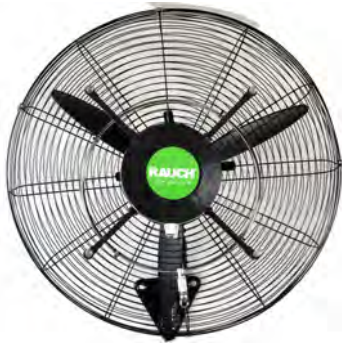
RAUCH Wandventilator NV

RAUCH Zerstäubungseinheiten diese mit einer HD 70 Pumpentechnik kombiniert werden können.