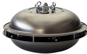
RAUCH UFO - RSM