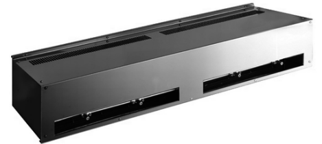
RAUCH Radial Ventilator RTF