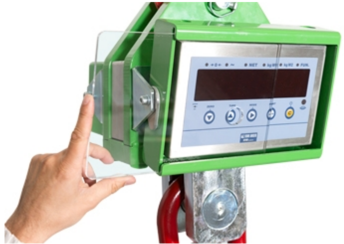
Schutzscheibe aus Plexiglas für Display und Tastatur