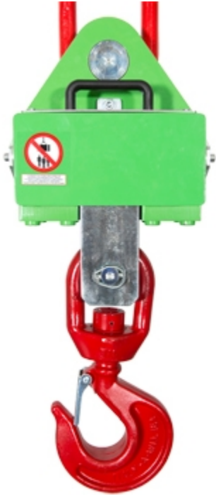
MCWHU: Sicht vom hinten