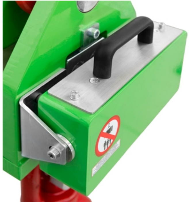
Serienmäßiges austauschbares Batteriefach