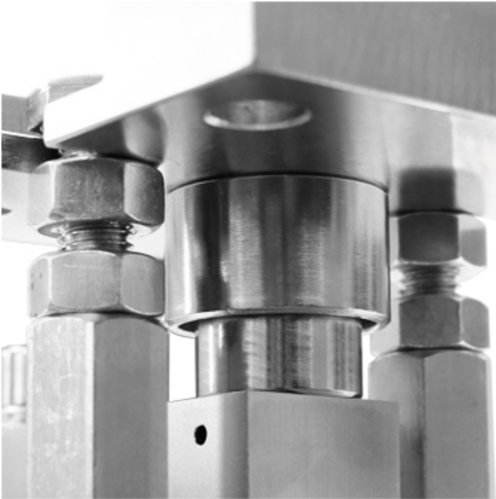
Detail sphärisches Kugelgelenk